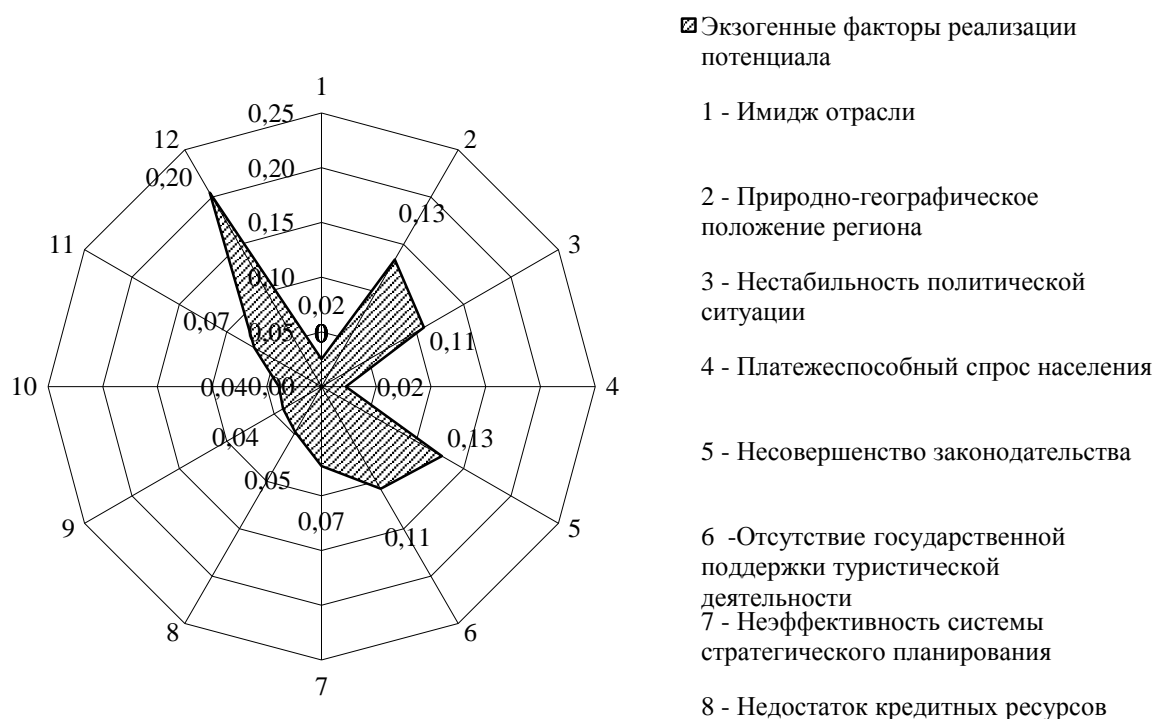
Рис. 1. Влияние экзогенных факторов на реализацию потенциала туристской отрасли Крыма*