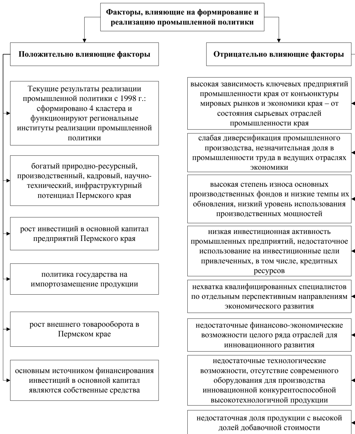
Рисунок 2 Тенденции и факторы развития промышленных предприятий в Пермском крае

– богатый природно-ресурсный, производственный, кадровый, научно-технический, инфраструктурный потенциал Пермского края.