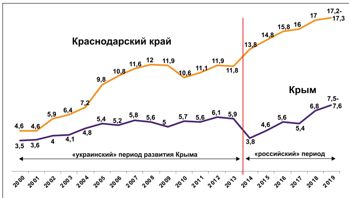
Рис. 2. Динамика турпотока Краснодарского края и республики Крым, 2000–2019 гг. (млн чел.)