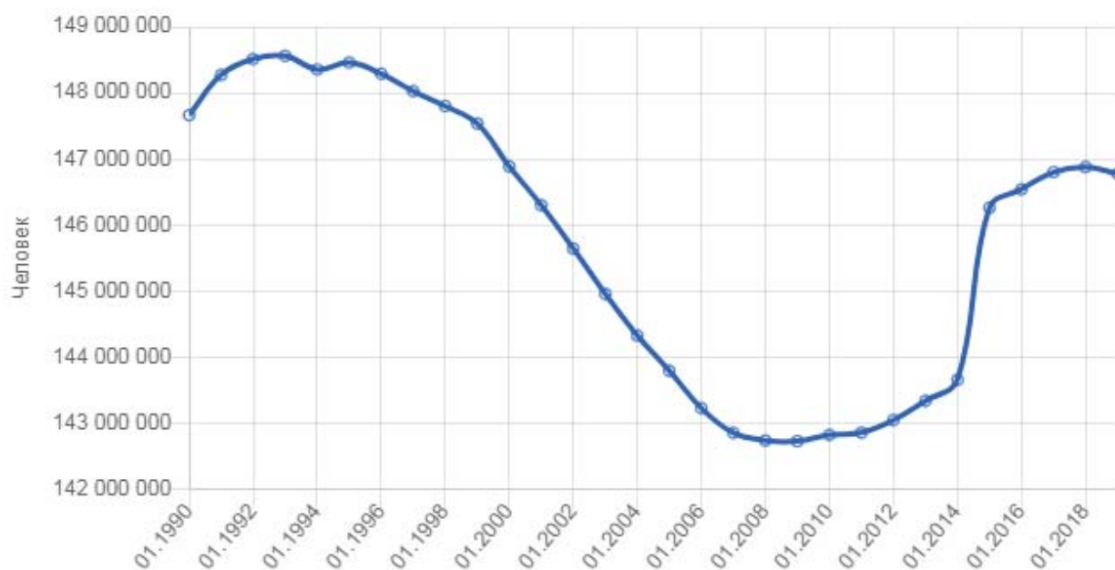
Рис. 1. Численность постоянного населения России на 1 января [1].

Из рисунка 1 можно отметить, что наблюдаются проблемы с демографической ситуацией в стране, начиная с 1996 года. Численность постоянного населения с каждым годом стремительно снижалась, рождаемость детей была на минимальном уровне, а уровень смертности имел тенденцию к возрастанию. Пиковая точка снижения постоянного населения в России приходилась на период мирового экономического кризиса 2008–2010гг. Начиная с 2010 г. показатели численности населения имели тенденцию к росту. Предположительно, причиной увеличения численности населения считается активная позиция президента РФ В. В. Путина к вопросу государственной поддержки семьям, имеющим второго ребенка и более детей. Согласно утвержденному закону РФ от 29.12.2006г. № 256–ФЗ принято, что материнский капитал предназначен для реализации программы государственной поддержки семьям и выплачивается из средств федерального бюджета. Проанализируем динамику изменения суммы материнского капитала с 2007 г. до настоящего времени с учетом прогнозных значений (см. табл. 1 и рис. 2). Данная таблица 1 и рисунок 2 составлены с учетом официальных данных, утвержденных законом РФ от 29.12.2006г. №256 (с изм. и доп.) на определенный год исследования.